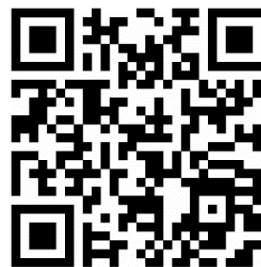
สมัครออนไลน์