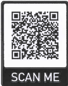
ดาวน์โหลดรายละเอียด

กลุ่มนิเทศ ติดตามและประเมินผล สำนักงานศึกษาธิการจังหวัดเชียงใหม่ โทรศัพท์ ๐-๕๓๒๑-๘๕๙๙ ต่อ ๒๖ โทรสาร ๐-๕๓๒๑-๘๕๙๙ ต่อ ๐ หรือ ๐๘-๔๘๙๔-๘๖๓๘ ในวันและเวลาราชการ เว็บไซต์สำนักงานศึกษาธิการจังหวัดเชียงใหม่ www.cmpeo.go.th หรือทางเพจ Facebook สำนักงานศึกษาธิการจังหวัดเชียงใหม่ หรือ ดาวน์โหลดรายละเอียด https://bit.ly/3xuYKbV