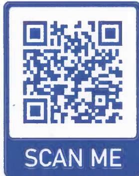
สมัครพร้อมส่งผลงาน